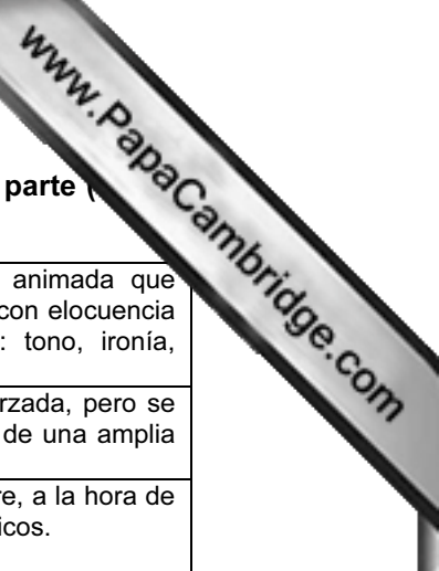
Tabla A: Descripción de las puntuaciones para el Componente 5, primera parte (individual) (10 puntos)